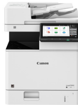
imageFORCE 710F* (Modelo sin finalizador)