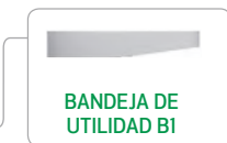
BANDEJA DE UTILIDAD B1