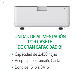
UNIDAD DE ALIMENTACIÓN POR CASETE DE GRAN CAPACIDAD BI