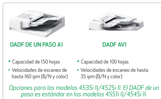
DADF DE UN PASO A1